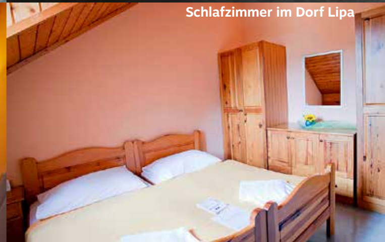
Schlafzimmer im Dorf Lipa