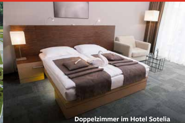
Doppelzimmer im Hotel Sotelia